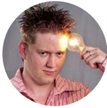
Автор: Алексей Шувалев